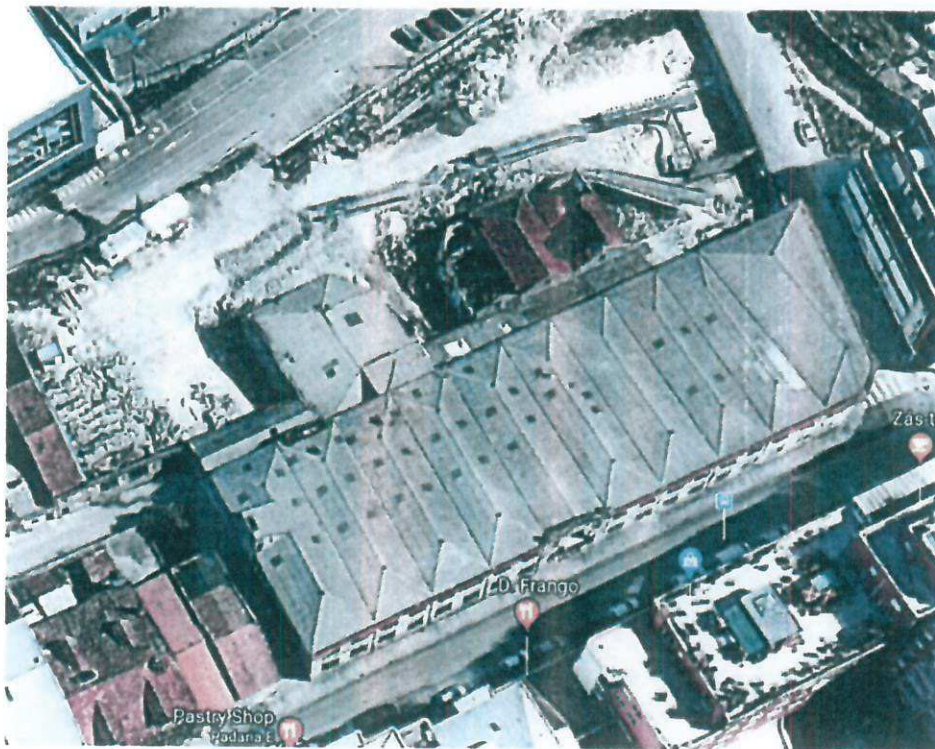
Fig. 1 – Planta de localização (base Google earth)

O valor encontrado para o valor patrimonial é de acordo com valores de mercado e para as especificidades do local em causa em total observância à legislação específica em vigor nomeadamente o artigo 26 da Lei n.º 56/2008 que procede quarta alteração do Código de Expropriações e da redação dada pelo artigo 93.º da Lei 64-A/2008, de 31 de Dezembro .