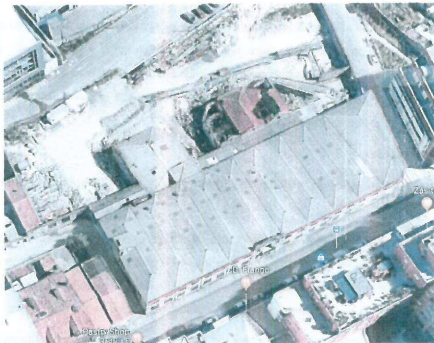
Fig. 1 – Planta de localização (base Google earth)

O valor encontrado para o valor patrimonial é de acordo com valores de mercado e para as especificidades do local em causa em total observância à legislação específica em vigor nomeadamente o artigo 26 da Lei n.º 56/2008 que procede quarta alteração do Código de Expropriações e da redação dada pelo artigo 93.º da Lei 64-A/2008, de 31 de Dezembro .